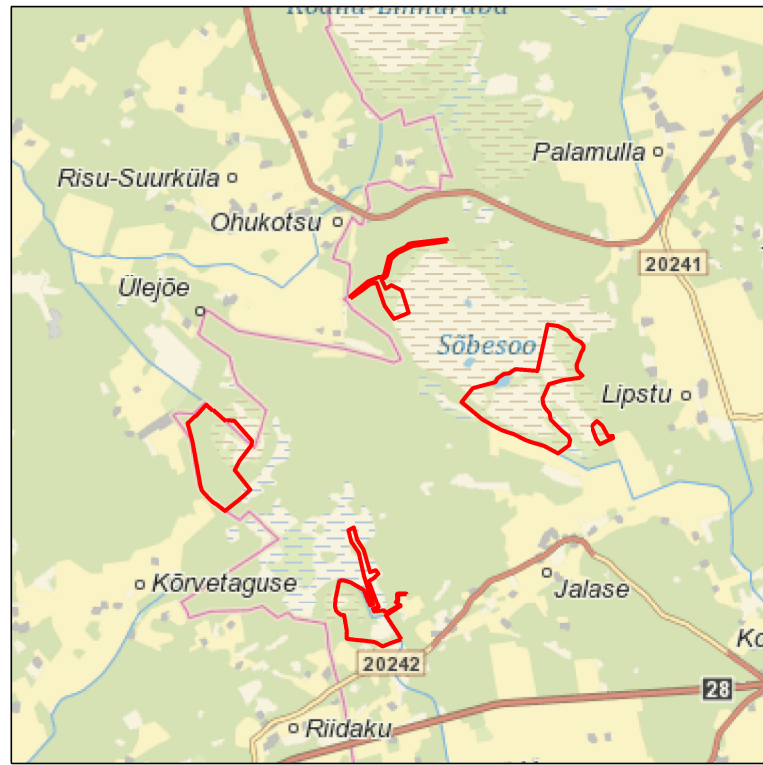
Kaardileht nr 631 Rapla